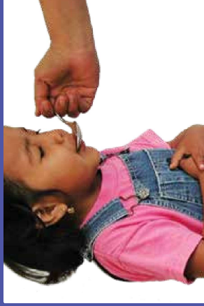
trong các loại thuốc như azarcon, greta, hoặc pay-loo-ah