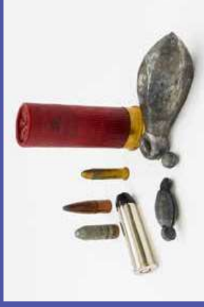
trong các loại đạn và chì câu cá