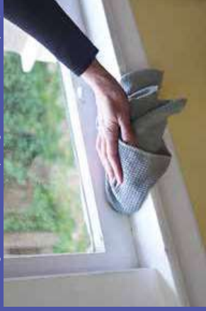
trong bụi trong nhà