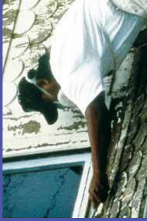
trên tóc, da, giày, và quần áo sau khi làm việc