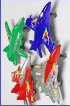
trong một số đồ chơi