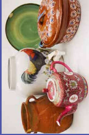
trong một số loại chén đĩa và nội nội