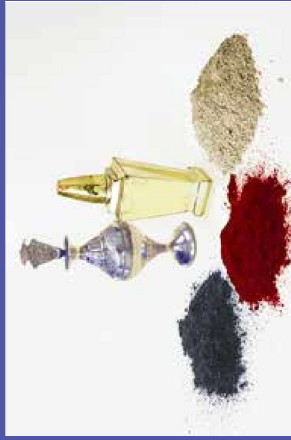
trong mỹ phẩm truyền thống, như kohl, surma, hoặc sindoor