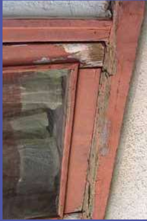
trong mảnh vụn sơn