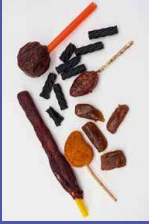
trong một số loại kẹo www.cdph.ca.gov/Programs/CEH/DFDCS/Pages/FDBBPrograms/FoodSafetyProgram/LeadInCandy.aspx