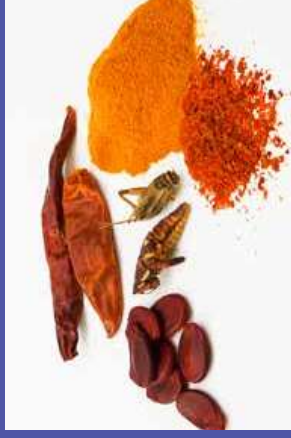
trong các loại thực phẩm và các loại gia vị có màu sáng sản xuất ngoài Hoa Kỳ