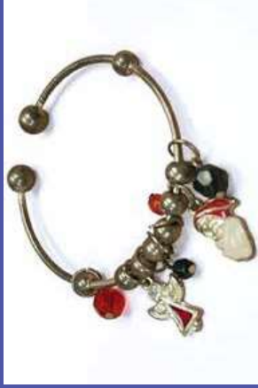
trong một số đồ trang sức https://dts.c.ca.gov/toxics-in-products/lead-in-jewelry/